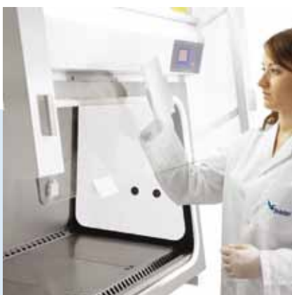
Fácil limpieza del interior del cristal.

La Bio II Advance dispone de una pantalla en color que permite comprobar fácil y rápidamente los parámetros de seguridad. Se muestra de forma visual el nivel de colmatación de los filtros, extremadamente útil para optimizar el servicio, y la velocidad de flujo laminar para controlar en todo momento el estado de la cabina.